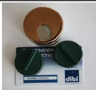
Kit defender "Key Protector" con chiavi e card