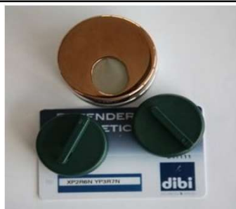
Kit defender "Key Protector" con chiavi e card