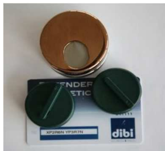
Kit defender "Key Protector" con chiavi e card